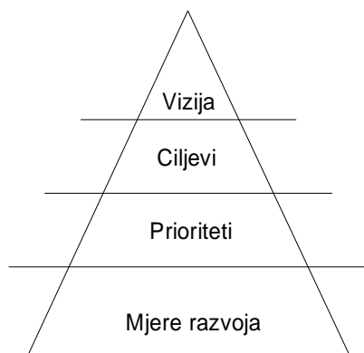
Slika 1: Strategija razvoja JLS-a

Mjere razvoja Općine Rogoznica predstavljaju najvažniji dio Strategije razvoja Općine Rogoznica. Općenito rečeno, mjere su srednjoročni putovi za postizanje prioritetnih ciljeva, a njima se također omogućava iskorištavanje postojećih resursa. Mjere razvoja predstavljaju konkretizaciju strategije, tj. ciljeva i prioriteta. Razvojne mjere služe kao smjer razvoja, koje su na snazi dok se u cijelosti ne postignu postavljeni ciljevi. One su, u tehničkom smislu, most između strateških ciljeva i konkretnih razvojnih projekata. Bez njih planirani razvoj ne bi imao konkretno uporište, te se u konačnici ne bi ni ostvario. Metodom Brainstorminga iskristalizirane su glavne projektne ideje koje su prihvaćene u izradi ovog strateškog dokumenta. U piramidalnoj strukturi mjere su jedini opipljivi i vidljivi dio strategije razvoja pojedine jedinice lokalne samouprave (u nastavku teksta: JLS).